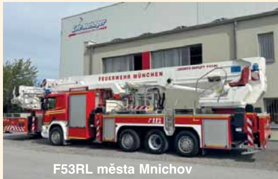
F53RL města Mnichov