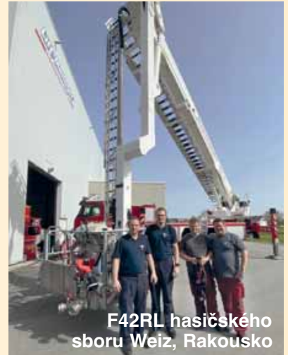
F42RL hasičského sboru Weiz, Rakousko

Vyškolený tým BRONTO společnosti Lift-Manager je pověřen jak krátkodobou údržbou a opravami, tak i dlouhodobými plánovanými desetiletými kontrolami, které jsou stanoveny na základě standardizovaných postupů výroby.