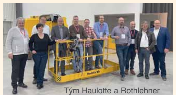
Tým Haulotte a Rothlehner