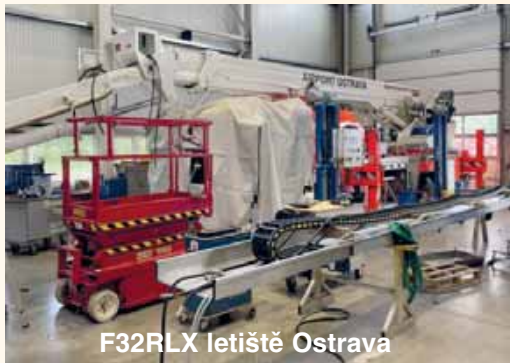
F32RLX letiště Ostrava

Ať už se jedná o letiště, průmyslové podniky nebo obce, dveře dílen společnosti Lift-Manager se pravidelně otevírají pro různé hasičské záchranné plošiny BRONTO . Již dva roky probíhá i spolupráce se státními i soukromými jednotkami z České republiky.