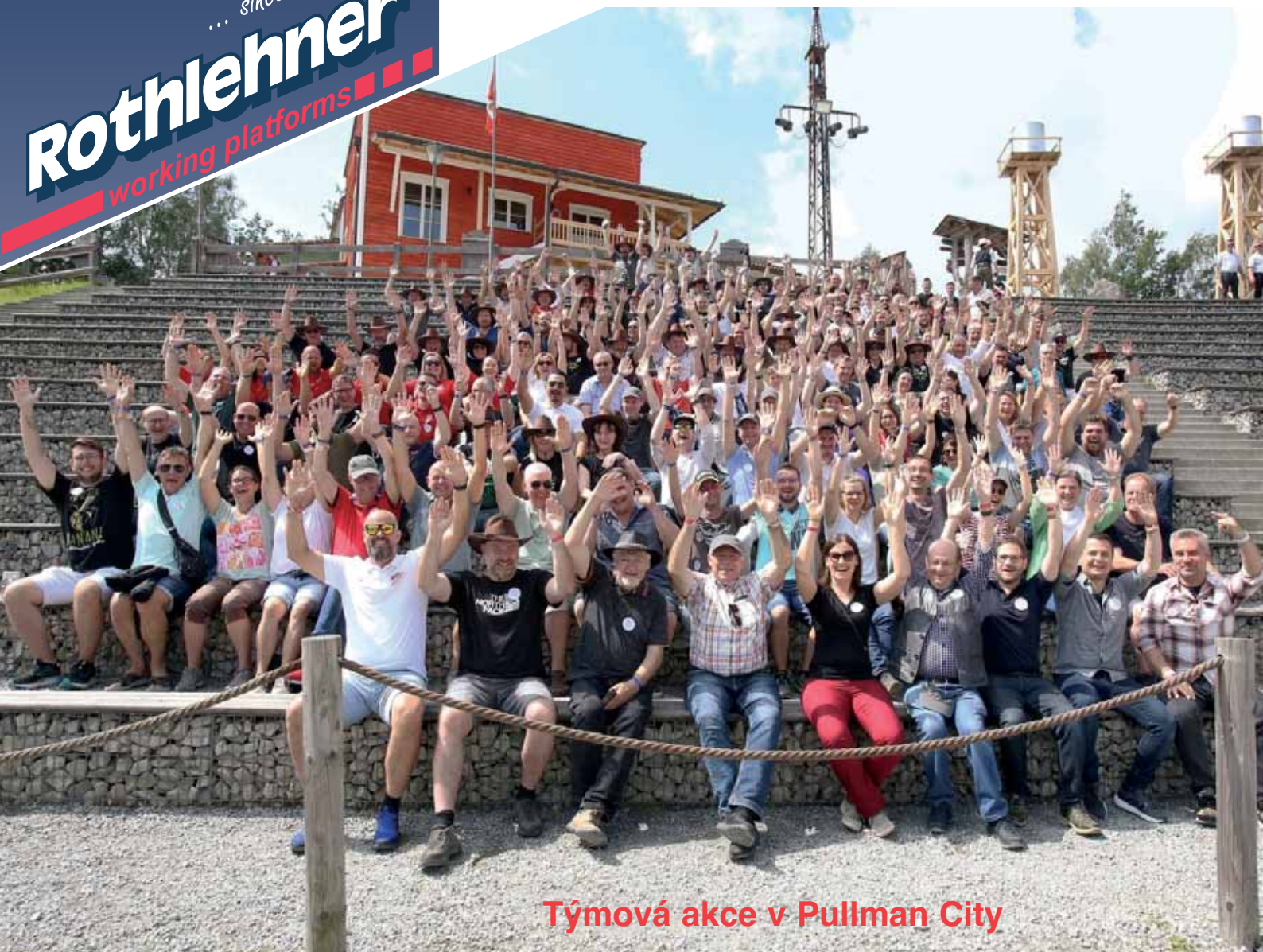
Týmová akce v Pullman City

... since 1976 Rothlehner working platforms